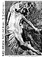
"G. RENDA" - POLISTENA

Sito WEB : http://www.istitutorenda.edu.it